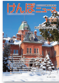
写真をメインにしたインパクトのある表紙