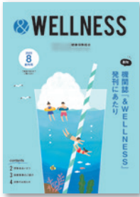
季節感が感じられる表紙