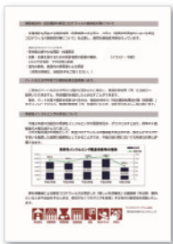
ExcelやWordの原稿や資料をご提供いただければ