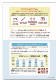
編集・制作スタッフが原稿整理からデザインレイアウトまで制作いたします