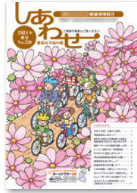
イラストを使用した優しい雰囲気表紙