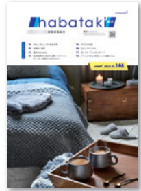
スタイリッシュな表紙