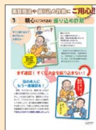
③ 親心につけ込む振り込め詐欺