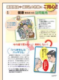
① 健康をねらった訪問販売