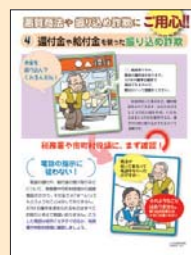
④ 還付金や給付金を装った振り込め詐欺