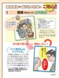
① 健康をねらった訪問販売