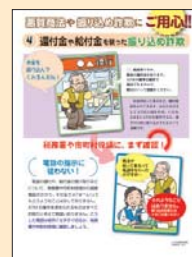
④ 還付金や給付金を装った振り込め詐欺