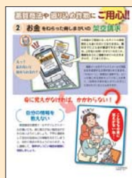
② お金をねらった脅しがいの架空請求