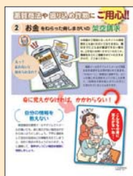
② お金をねらった脅しがいの架空請求