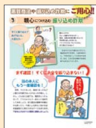
③ 親心につけ込む振り込め詐欺